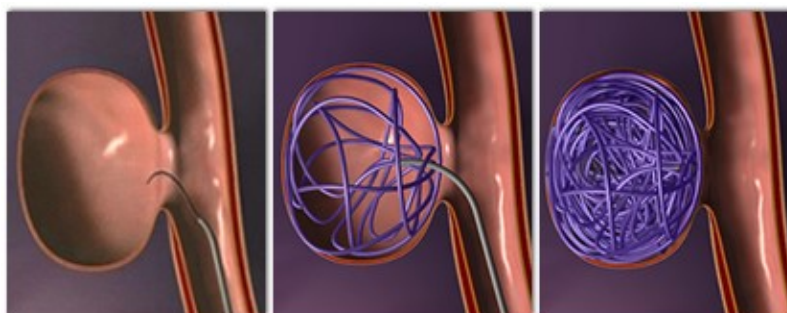
1: Het coilen van een aneurysma.

Via de katheter worden dan spiraaltjes (coils) van platina in het aneurysma gebracht, die daarin opkrullen en de holte van het aneurysma geheel opvullen. Hierdoor is de holte afgesloten van de bloedaanvoer en kan er niet opnieuw een bloeding optreden (zie afbeelding 1). De operatie wordt uitgevoerd door de radioloog.