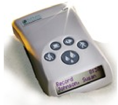
Mobiel urodynamisch registratieapparaat

De verpleegkundige legt u de werkwijze voor het onderzoek uit.