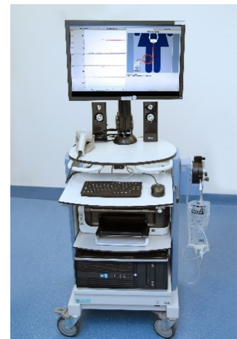
Afbeelding 2; meetsysteem